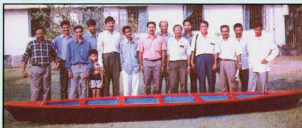
18 ft. fibre glass canoe fabricated