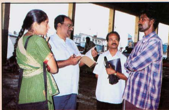
Scientists engaged in enumeration of boats

The small crafts were observed to be gradually vanishing from the fishing scene as the preference of fishermen is focused towards larger type of crafts performing multi-day fishing, due to economic reasons. A number of crafts were observed to be lying on the shore or in repair yards due to its un-sea worthy condition. Such crafts were not included in the enumeration.