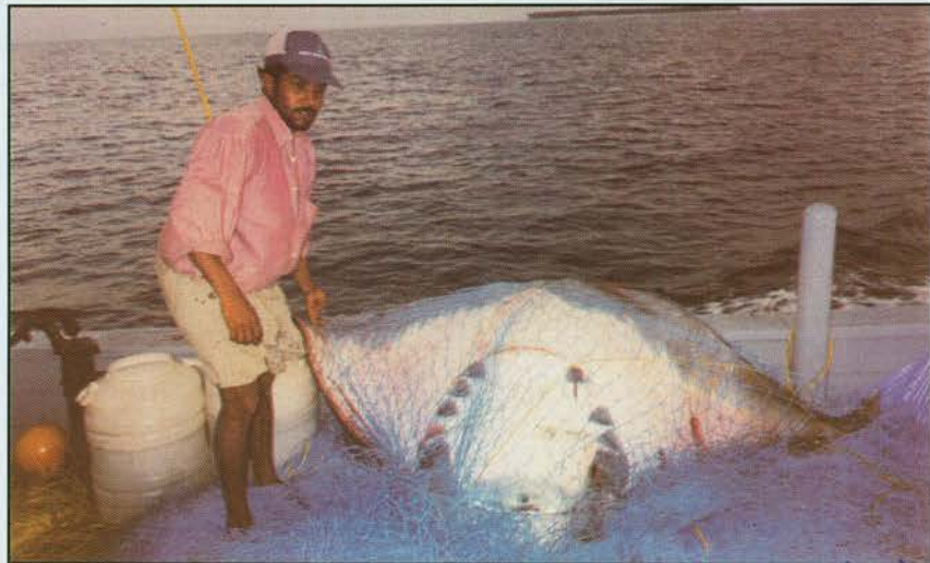
एच डी पी इ क्लोम जाल प्रयुक्त करके पकड़े गए 250 की ग्रा डेविल रे

एच डी पी ई (नीला) 1.5 और 2.0 एम.एम. डायामीटर और 100, 120, 140, 160, 200 एम.एम. के संपाश आकार से युक्त 210 x 6 x 3, 210 x 39 x 3 (सफेद एवं नारंगी लाल) के पॉलिएमाइड प्रयुक्त किया जाता है। प्रचालित प्रति यूनिट का औसतन