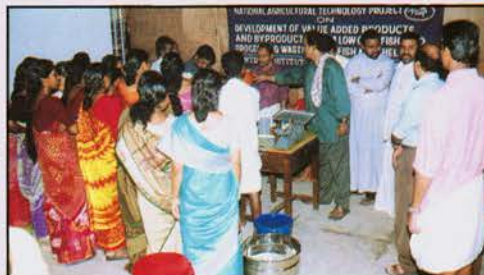
Training at KIDS, Kottappuram

Kottappuram Integrated Development Society is a social service Society functioning under the guidance of Diocese of Kottappuram. The KIDS have decided to take up production of fish products through their members who are fisherwomen. They have adequate facilities for setting up a production unit on a commercial scale. For acquiring the required technical know-how on production of various fish products they approached CIFT.