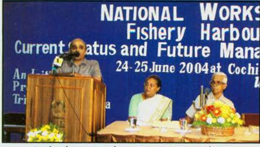
डॉ. के. देवदासन-कार्यशाला का उद्घाटन करते हुए