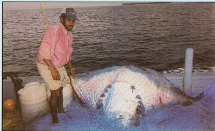
A 250 kg Devil ray caught by using HDPE gill net

HDPE (Blue) 1.5 and 2.0 mm diameter and Polyamide (PA), 210x6x3, 210x39x3 (White and Orange Red) having mesh sizes 100, 120, 140, 160 and 200 mm were used for the fishing operations. The average size of each unit operated was 30 m in length and