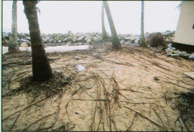
समुद्री अपरदन के कारण खुले हुए कांटों से युक्त नारियल के पेड़

पी आर ए बैठक में लोगों द्वारा दैनिक जीवन में सामना करनेवाली समस्याओं की चर्चा की गयी। चर्चा में समुद्री अपरदन शीघ्र ध्यान देने की बात बन गयी। यह सूचित किया गया था कि वर्तमान समुद्री भिन्ती 40 वर्षों तक पुरानी थी और इन वर्षों में कोई मरम्मत भी नहीं किया गया था। यह उनके नाश और परिणामस्वरूप इस क्षेत्र के समुद्री अपरदन का कारण भी