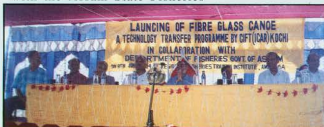
Launching of fibre glass canoes at Guwahati