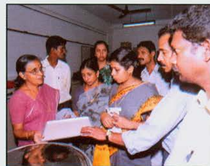
Training on value added products from fish