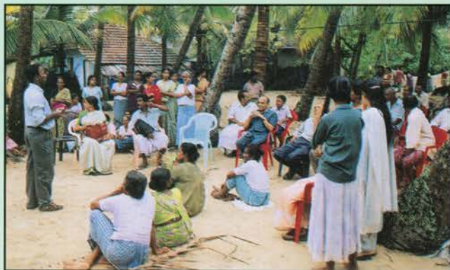
PRA on sea erosion under progress