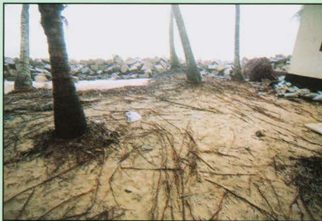
Coconut trees with exposed roots due to sea erosion

The PRA meeting proved conducive for the people to discuss some of the problems faced in their day-to-day life. Of the many problems voiced, sea erosion was the one requiring immediate attention. It was pointed out that the existing sea wall built about 40 years back had no maintenance all these years which was the cause for its destruction and