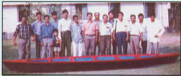
18 फीट फाइबर ग्लास डोंगी