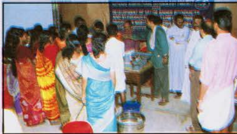
किड्स, कोट्टप्पुरम में प्रशिक्षण

कोट्टप्पुरम समेकित विकास समिति, कोट्टप्पुरम धर्मप्रदेश के मार्गनिर्देशन के अधीन कार्यरत सामाजिक सेवा समिति है। किड्स ने उनके सदस्य मछुवारियों के ज़रिए मत्स्य उत्पन्न के उत्पादन करने के लिए निश्चय किया। उनके पास वाणीज्यिक तौर पर उत्पादन के लिए एक उत्पादन यूनिट की स्थापना के लिए आवश्यक उचित सुविधाएँ हैं। लेकिन विभिन्न मत्स्य उत्पन्न के उत्पादन संबंधी तकनीकी जानकारी सी आई एफ टी से प्राप्त की गयी।