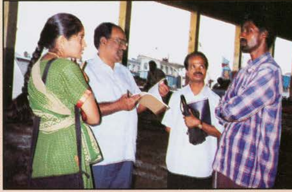
नावों के आकलन में कार्यरत वैज्ञानिक

केरल के मत्स्यन व्यवसाय द्वारा प्रयुक्त (40' LOA से निम्न) और 'माध्यमिक' किया गया। विभिन्न प्रदेशों पर यान लंगर डालकर पडने पर भी उनके संचालन क्षेत्र पश्चिमी तट रिपोर्ट किया गया। छोटे यानों पर मत्स्यन की अवधि केवल एक दिन की थी जहाँ माध्यमिक एवं बड़े यानों का बहु-दिन के मत्स्यन था। परिगणन किए गए प्रत्येक वर्ग के नावों की संख्या नीचे दिया गया है। इंधन आकलन 'भारत के मत्स्यन व्यवसाय द्वारा इंधन उपभोग प्रतिमान पर अध्ययन' नामक अनुसंधान प्रोजेक्ट का मुख्य प्राथमिक लक्ष्य था। अध्ययनार्थ, राज्य में चालू समय प्रचलित यंत्रीकृत यानों की वास्तविक संख्या संबंधी सूचना आवश्यक है। इसके संबंध में उपलब्ध सूचना अपर्याप्त होने के कारण 2003 के दौरान केरल के यंत्रीकृत यानों का व्यापक भौतिक आकलन किया गया। विभिन्न हारबरों, जट्टियों और अन्य आन्तरिक जल विस्तार क्षेत्रों एवं नाव मरम्मत याडों पर यान लंगर डालकर पडे रहने के कारण जून 15 से जुलाई 31 तक का ट्रॉल निरोध अवधि को इस अध्ययन के लिए चुन लिया गया। पूरे राज्य के प्रतिपादन करके कोल्लम, कोचिन, और कैलिकट क्षेत्रों का अध्ययन पूरा किया गया। परिगणन के लिए उसी प्रदेश के या आंतरिक क्षेत्रों के किराये के नावों को लिया गया था।