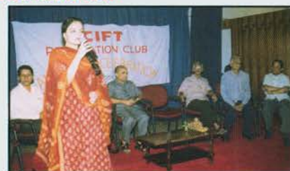
Chief Guest enchanting the audience with her melodious voice