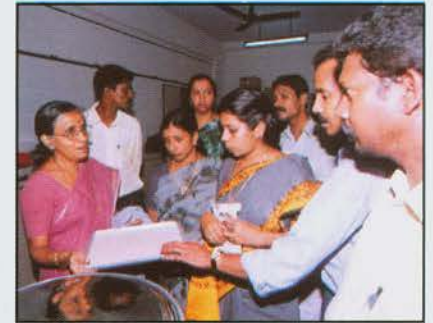
मत्स्य से मूल्य जोड़ उत्पादों पर प्रशिक्षण